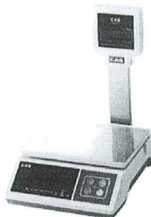
SW (модификация со стойкой)